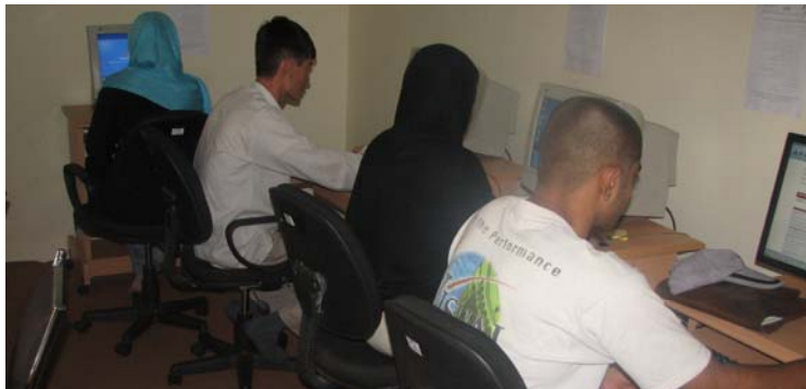
مستفیدین مرکز منابع آپیکس در دفتر مجتمع جامعه مدنی افغان - کابل - اگست ۲۰۰۷.

کاونترپارت از مراکز منابع فواید محسوس میبند. آنها به مؤسسات جامعه مدنی که مربوط آپیکس میباشد و مؤسسات دیگر یک سان در ابعاد مهم برنامه ریزی پروژه همکاری تخنیکی فراهم میکنند. علاوه، این مراکز در برخی موارد نخستین اتصال همگانی انترنیت را در ولایات مانند فاریاب فراهم کرده یا یگانه جاهایی که زنان میتوانند برای دسترسی به انترنیت به آن بروند مانند کندهار عرض اندام نموده است. لهنذا، این مراکز برای صدها مردم، بخصوص زنان، به معلومات مهم در باره جهان خارج دسترسی فراهم کرده است. در این جا فواید دیگر نیز وجود داشت. دو نفر از رؤسای همکار آپیکس تذکر داد که این مراکز به روابط بهتر با مسؤولان محلی دولتی که از این مراکز استفاده میکند، منتج شد. همچنان، آنها توضیح داد که این مراکز بخاطر فراهم نمودن یگانه خدمات گرانها به مردم در بهبود حیثیت و وقار مؤسسات آنها و در مجموع مؤسسات غیر دولتی کمک کرده اند.