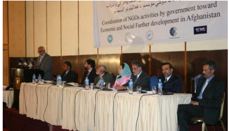
د افغانستان د اقتصادي او ټولنيز غوره پرمختگ په منظور د دولت او نادولتي مؤسسو د غوره اړېکو دوه ورځنی کانفرانس—کابل—می ۲۰۰۷.

د روان کال د می په ۲۲مه او ۲۳مه نېټه، د کاونټر پارټ او آپکس پروگرام شریکبانې مؤسسې د په گټه نه ولاړ قانون له پاره نړیوال مرکز (ICNL) د افغانستان د اقتصادي او ټولنيز غوره پرمختگ په منظور د دولت او نادولتي مؤسسو د غوره اړېکو تر نامه لاندې په کابل کې د دوه ورځنی کانفرانس کوربه و. ددغه کانفرانس هدف دا و چې د انجوانو د قانون په تطبیق کې غوره والی راشي او په دې توگه د غیر دولتي مؤسسو د سکټور او دولت تر منځ اړیکې غښتلې شي.