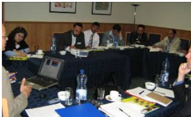
افغان پلاوي چې د کاونټرپارټ او د په گڼو نه ولاړ قانون له پاره نړيوال مرکز له خوا په علمي سير سهيلي افريقا ته تللی و

د په گڼه نه ولاړ قانون له پاره نړيوال مرکز (ICNL) او کاونټرپارټ نړيوالې مؤسسې د اقتصاد وزارت د ٦ تنو او د افغانانو له پاره د مرستو د انسجام د ادارې (اکبر)، او د افغاني غير دولتي مؤسسو د پيوستون ادارې (اې اين سي بي) او د افغاني ښځو د شبکې (اې ډبليو اين) مؤسسو څخه د ٣ تنو کارمندانو له پاره د سهيلي افريقا د علمي سير انتظام کړی و. ددغه علمي سير هدف دا و چې په سهيلي افريقا کې د نادولتي ټولنو د قانون تطبيق له نږدې وگوري، ستونزې او مسايل يې په نخښه کړي او دا چې ددغه سفر کوونکو د ظرفيت کچه لوړه او تجربه يې زياته شي.