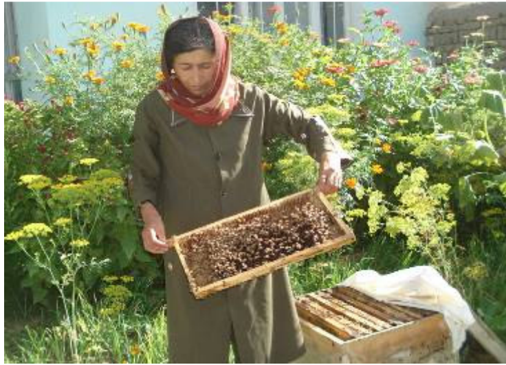
نازیه هره ورځ د خپلو مچيو صندوقونه گوري چې په دې خبره خان ډاډه کوي چې د شاتو د تولید له پاره یې قابېونه پاک او سوتره دي.

د کاونټرپارټ د بلاعوضه مرستو په مټ د بدخشان ولايت د داوطلبو بنځو مؤسسې ۱۲۵ کورنيو ته په دغه ولايت کې د شاتو د مچيو د ساتنې ټریننگونه او همدا راز د مچيو بکسونه ورکړل. دغو ټریننگونو دوی و توانولې چې د شاتو مچۍ ښې وساتي او د شاتو غوره حاصل ورځني واخلي، چې په دې توگه ددوی د کورنيو عایداتو له پاره دا یوه غوره منبع وگرځېدله. د بدخشان د داوطلبو بنځو مؤسسې په دغه ولايت کې همدا راز د لیک لوست او روغتیا پوهنې په برخه کې هم ۲۵۰ تنو بنځو ته ټریننگ ورکوي.